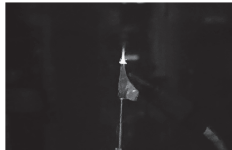
図 3 大気圧プラズマジェットの写真

本研究室では、大気中プラズマや液中プラズマを用いた超高速な炭素膜の成膜を目指しています。現在、安定したプラズマ生成を行うために試行錯誤を繰り返しており、大気圧プラズマ（図 3）や液中プラズマのプラズマ生成が可能になった段階であり、炭素膜を得るまでには至っていません。今後は炭素膜の超高速成膜に向けて炭素膜の生成について検討中です。